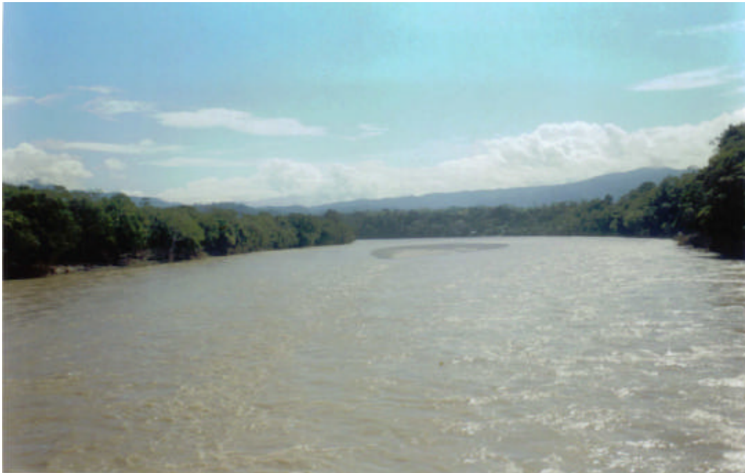
Foto 1.- Río Santiago estación Santiago Philippe Magat Quito – Noviembre 2003