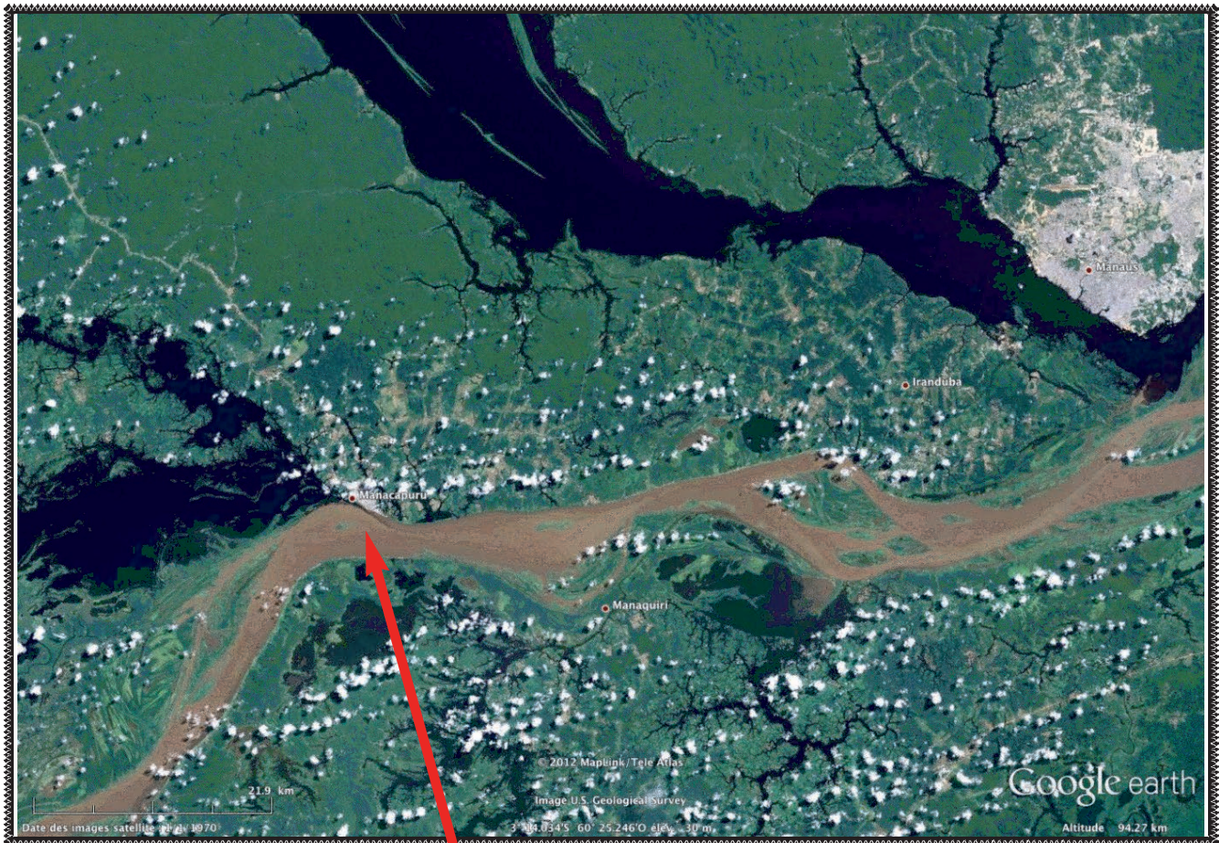
Localisation du point de prélèvement sur le rio Solimões à Manacapuru.