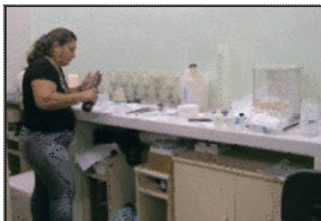
Filtration à l'Université Fédérale d'Amazonas - Manaus