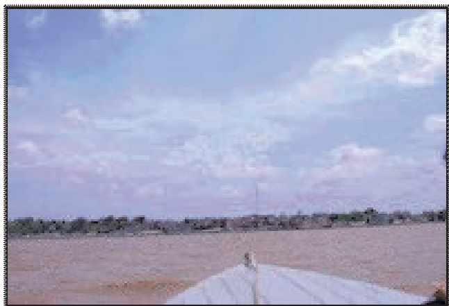
Le site de prélèvement sur le rio Solimões à Manacapuru