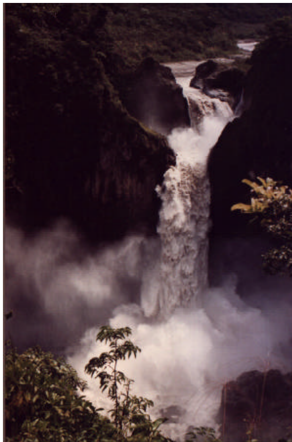
Cachuela San Rafael, Río Coca

Quito ⇨ Coca ⇨ Nuevo Rocafuerte ⇨ Tena ⇨ Quito Noviembre de 1998